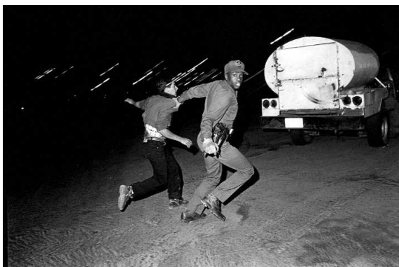
Frontière americano-mexicaine. Des migrants viennent de franchir le mur. Les trente agents de la Border Patrol qui surveillent durant la nuit un peu plus de 40 km de frontière se lancent à leur poursuite et procèdent à leur arrestation. CALEXICO, ETATS-UNIS, 2000