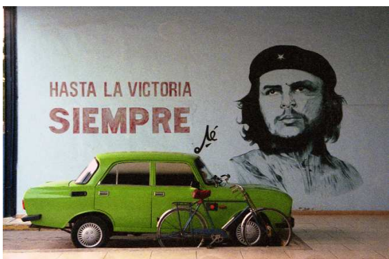
Les routes du Che. La station de bus de Santa Clara. La ville fut libérée par le Che et ses troupes, victoire qui précipita la fuite du dictateur Batista. CUBA, 2007