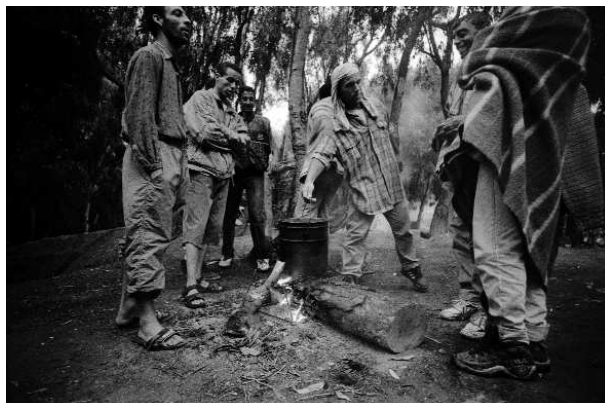
Camp de rétention des immigrants à Ceuta, enclave de l'Espagne au Maroc. 1997