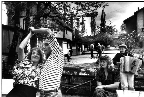
Banlieues buissonnières, guinguette La Roseaie, Moustique et ses musiciens. CHAMPS-SUR-MARNE, FRANCE, 1989